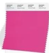
PANTONE 18-2143 Beetroot Purple