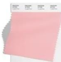
PANTONE 12-1708 Crystal Rose