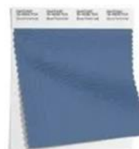
PANTONE 16-4036 Blue Perennial