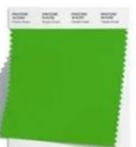
PANTONE 16-6340 Classic Green