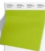
PANTONE 13-0443 Love Bird