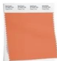
PANTONE 15-1530 Peach Pink