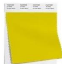
PANTONE 14-0756 Empire Yellow