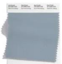
PANTONE 14-4316 Summer Song

ООО НПФ БАРС-2 предлагает переработчикам полимерных материалов концентраты БАСКО™ , соответствующие самым актуальным трендам в области цвета для предстоящего 2023 года: