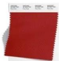
PANTONE 18-1664 Fiery Red

Для модной палитры Pantone New York весны и лета 2023 эксперты выбрали оттенки, призванные поощрять цветовые эксперименты и индивидуальность. Описание модных оттенков заряжено позитивом. Как, например, Empire Yellow “излучающий радость”, или Classic Green, который по словам Pantone, обладает полезными для здоровья качествами. 😊