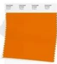
PANTONE 15-1335 Tangelo